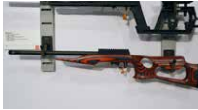
Eine KK-Büchse aus dem Hause Volquartsen, bestens geeignet für die Disziplinen der Gallery Rifle bzw. DKS 2. Perfekt verarbeitet auf Basis des Ruger 10/22, jedoch vollständig modifiziert bspw. mit Kompensator und Sichtcarbon-Ummantelung. Wunderschön!

Nun bleibt die Frage, welche Messe ist die Größere oder die Bessere? Nun, die Frage welche Messe die Größere ist, ist ein Zankapfel der beiden Messen seit Jahren, diese Frage lässt sich als Außenstehender nicht beantworten. Rein subjektiv vermute ich, dass die IWA größer ist. Welche Messe die bessere Messe ist muss ich ebenfalls wieder subjektiv beantworten, für mich ist die IWA die bessere Messe. Die großen Aussteller sowohl