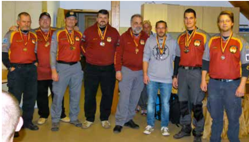
Die erfolgreiche SLG Waldbrunn.

Über 145 Schützen waren auf der Anlage des SV Großsachsenheim und absolvierten 400 Starts. Selbst die Anreise aus dem Wetteraukreis, Würzburg, Weiden und Dillingen/Donau war kein Hinderungsgrund, an diesem Wettbewerb teil zu nehmen.