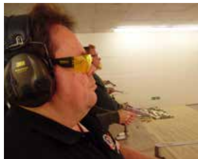
Die Schützen sind bereit.