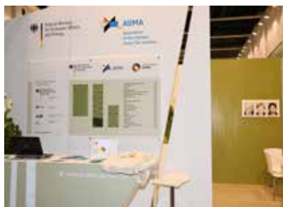
Der Stand des Wirtschaftsministeriums in Kooperation mit der AUMA. Hier stehen kompetente Ansprechpartner für alle Fragen zur Verfügung.

wert besitzt, es wirkt so, dass Jäger und Sportschützen die Hauptklientel der Aussteller darstellt. Es gibt eine Halle nur für Optik, alle Hersteller die man weltweit kennt haben hier einen aussagekräftigen Stand. Zudem haben die deutschen Großhändler wie AKAH, Frankonia, etc. schöne Stände in Nürnberg. Ansonsten sind die großen Aussteller auf beiden Messen