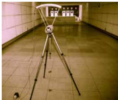
Sogar Hightech vom Allerfeinsten bringt nicht unbedingt mehr Klarheit in Bezug auf das, was uns alle 2018 erwartet...