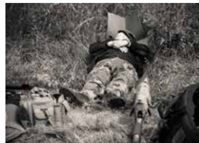
Wir betreten feuertrunken, Himmlische, dein Heiligthum...

zwischen Hoch- und Niederhaus zerlegte sie auf kürzeste Distanz die anfliegenden Scheiben, bevor die Zuschauer sie überhaupt ausgemacht