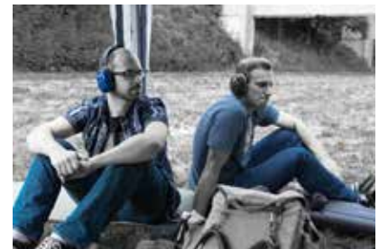
Die (b)lauen Blues Brothers in Blue Jeans in Hohenhorn.

Also wie in jedem Januar auf nach Garlstorf in die Nordheide: Zwei Stunden Raumschießanlage mit Kurz- und Langwaffen - etwas andere Ziele als sonst. Virtuelle Moorhühner erlegen, Farbeimer durchlöchern und auslaufen lassen, Dosen zum Tanzen bringen. Oder einfach mal sein Glück an ebensolchen Rädern versuchen, mit Reflexvisier ist das gar nicht sooo schwierig... Wesentlich herausfordernder sind da schon die Jagdszenen, zum Beispiel die durchs Unterholz rasenden Sauen. Getroffen! Blattschuss! Aber leider nicht die Sau, sondern den Baum vor ihr.