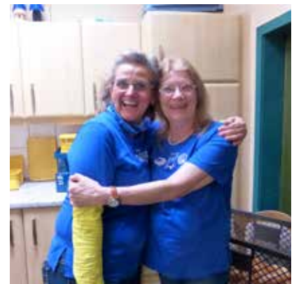
Geschafft, alle waren zufrieden und satt.