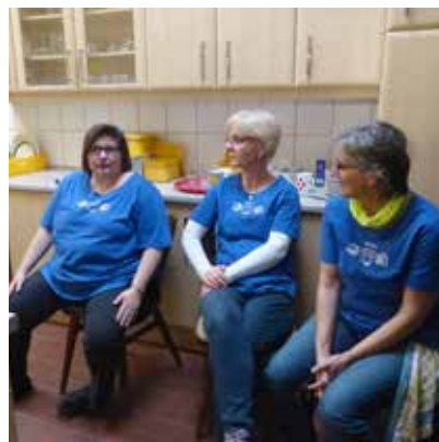
...kleine verdiente Pause.