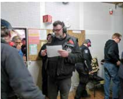
Startliste? Noch stimmt sie.

Ergebnisse und viele Fotos wie immer auf unserer Internetseite: http://www.slg-stade-hagen.de/