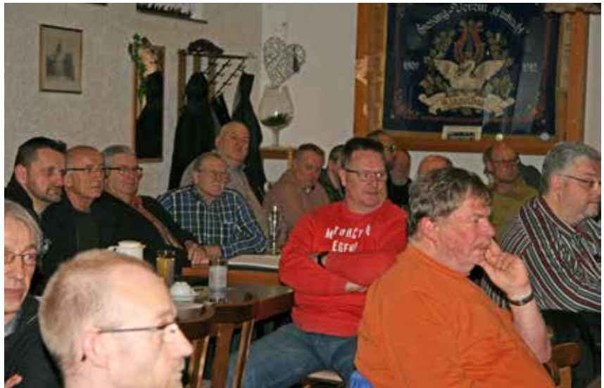
Gespannt folgen die Teilnehmer der SLG-Leiter-Sitzung den Berichten des Vorstands.

Am Schluss der Sitzung wurde im Rahmen des Tagesordnungspunkts „Sonstiges“ die Gelegenheit genutzt über diverse Themen wie z.B. die Ausgestaltung der zentralen Siegerehrung zu diskutieren. Einige interessante Punkte wurden diesbezüglich angemerkt, die gezeigt haben, dass es Gesprächsbedarf innerhalb des hessischen Landesverbands gibt, dem der Vorstand gerne weiter nachgehen wird.