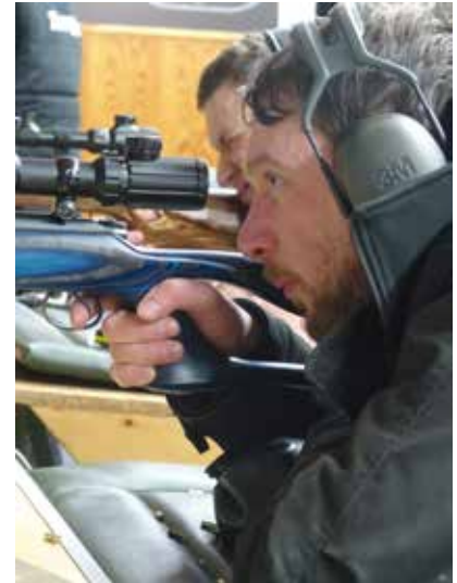
Nur keine Hektik.

Mit einer „geringen Verzögerung“ von ca. einer Stunde konnten wir zur Siegerehrung schreiten, so etwas