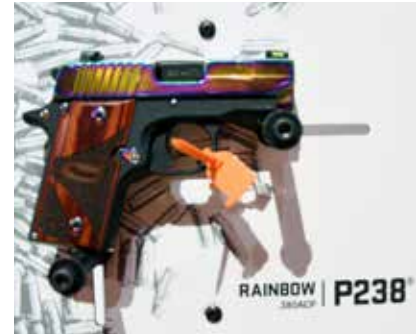
Ein Exponat für den amerikanischen Markt. Soll schick sein und in die Handtasche passen...