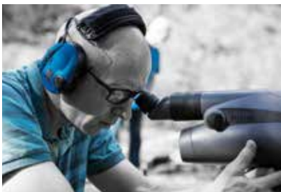
Brille und Spektiv - und trotzdem bleibt die Zukunft verborgen, unklar und dunkel...

Oder man blickt gemeinsam zurück in das vergangene Schützenjahr – und vielleicht sogar darüber hinaus –, wird besinnlich und ruhig und grübelt über all die verpassten Chancen und Gelegenheiten nach und nimmt sich vor, nun doch endlich bald eine eigene Waffe zu kaufen und die Vereinswaffe großzügig den Kameraden zu überlassen.