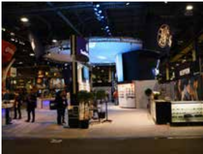
Der Stand von Smith & Wesson ist recht ähnlich so auch in Nürnberg zu bewundern. Auch die Exponate sind die gleichen.

aus Deutschland als auch weltweit sind auf beiden Messen vertreten, jedoch sind die deutschen und europäischen Spezialisten auf der IWA vertreten, auf der Shot Show nicht.