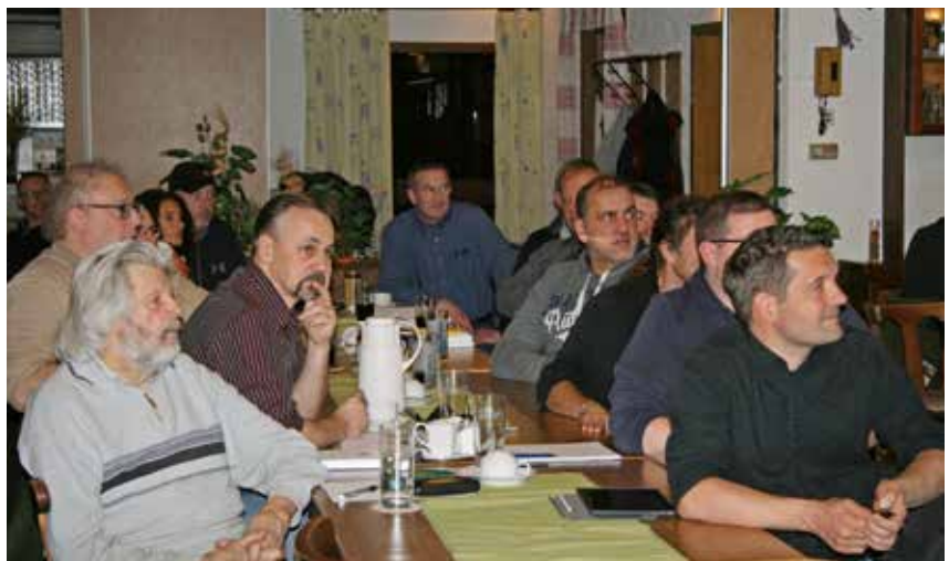
Auch einige Landesreferenten sind geblieben um die Sitzung mitzuverfolgen.