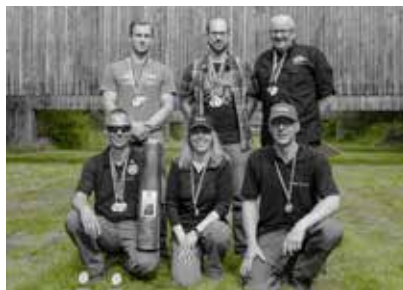
Laufet, Brüder, eure Bahn, Freudig, wie ein Held zum Siegen...

Zum Abschluss gab's dann noch einmal ganz großes Freiluftkino. Kerstin zeigte den ehrfürchtig staunenden Newbies, wie gut man durch intensives Training mit der Flinte werden kann: Von der Position 8 genau