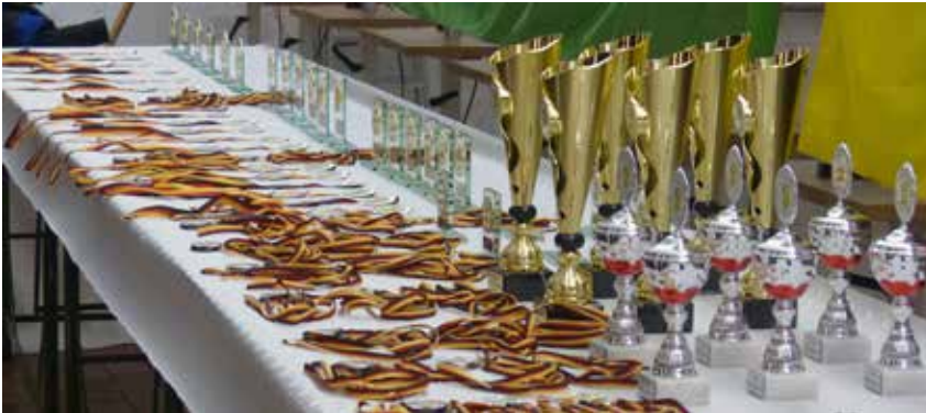
Pokale und Medaillen für neun Disziplinen mussten sortiert werden, alleine schon für die Mannschaften waren es 108 Medaillen, da war Sorgfalt angesagt.

oder Frikadellen „Sonjas Art“ kein Problem, 35 Liter Chili con Carne und neun Torten standen bereit.