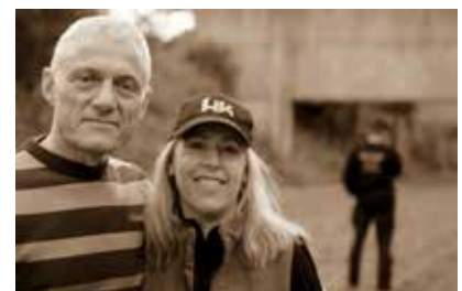
Wem der große Wurf gelungen, Eines Freundes Freund zu sein...

sachkundig auf unbekanntes Terrain führte: „Das hier heute ist eigentlich kein Schießen, das ist eher so etwas wie Ballet oder Tanzen...“ „Ihr müsst die Flinte führen wie einen Gartenschlauch und dann die Scheibe ordentlich nass machen...“