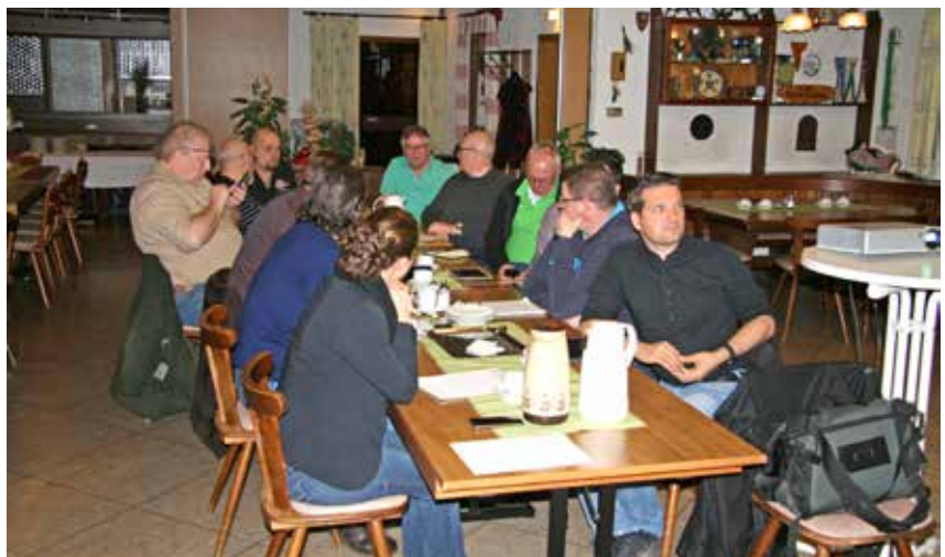
Besprechung und Auswahl der Schießtermine für 2019 beim jährlichen Referenten-Treffen.