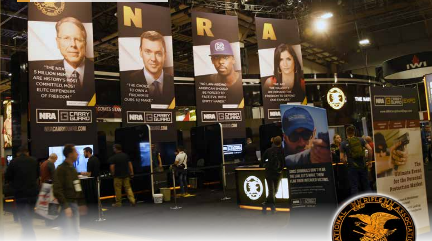
Der Stand der National Rifle Association of America. Imposant, gigantisch, gewaltig. Mit einem so starken Rückhalt in der Bevölkerung gesegnet lässt es sich gut repräsentieren.