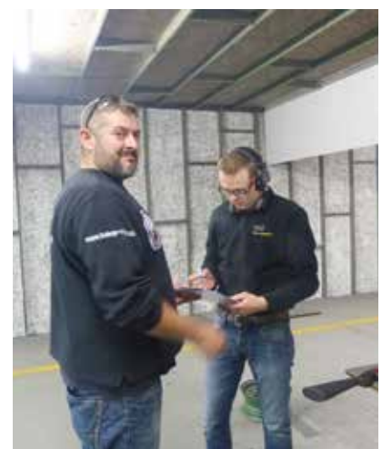
Auch die ROs waren mit dem Ablauf zufrieden.