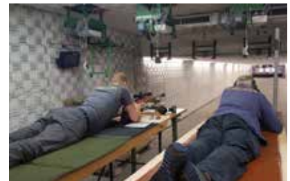
In aller Ruhe vorbereiten...

Es zeigte sich bei dieser Landesmeisterschaft das es letztendlich der Schütze selber ist, der das Ergeb-