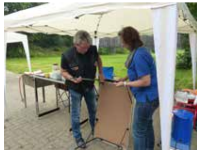
Schnell aufbauen, alle warten aufs Frühstück.