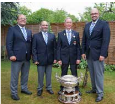
Das BDMP-Team Thüringen erringt den Nobel.