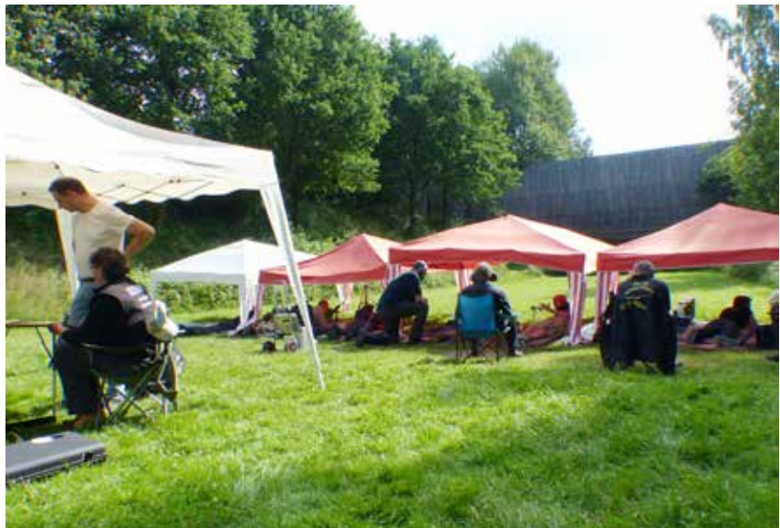
Fast wie auf dem Campingplatz.

Manchmal frage ich mich warum machen wir das alles, die Vorbereitungen die keiner sieht, die bange Frage wie das Wetter wird, haben wir an alles gedacht, alles eingepackt, mitten in der Nacht aufstehen, mit Sack und Pack 1,5 Stunden nach Hohenhorn fahren, den ganzen Tag auf den Beinen, alles wieder verstauen, auf der Hinfahrt war alles verstaut,