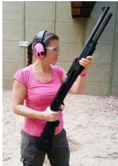
Die einzige weibliche Teilnehmerin.

Allgemein wurden die klassischen Einser-Disziplinen eher verhalten angenommen. Hier kann man nur alle Kameraden auffordern, sich in Zukunft aktiver zu beteiligen, da die Landesmeisterschaften in diesen Disziplinen sonst im nächsten Jahr „mangels Masse“ abgesagt werden müssten.