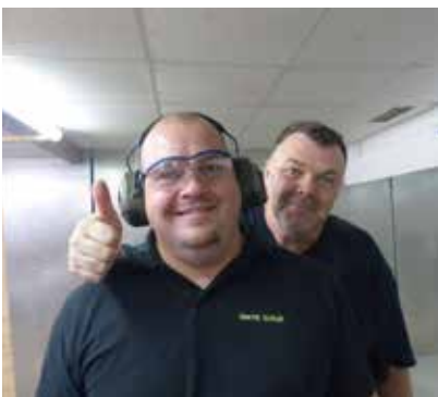
Zufrieden und gut gelaunte Teilnehmer.

nicht jeder Schiessstand bietet die Möglichkeit zum Training oder Wettkampf, Spaß macht es aber richtig.