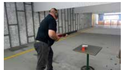
Die langen roten...

sportlichen Art. Der Stand in Tasdorf war gut belegt, gut das gleichzeitig auf zwei Ständen geschossen werden konnte. In den Disziplinen Fallscheibe Schrot waren es mit 89 Starts al-