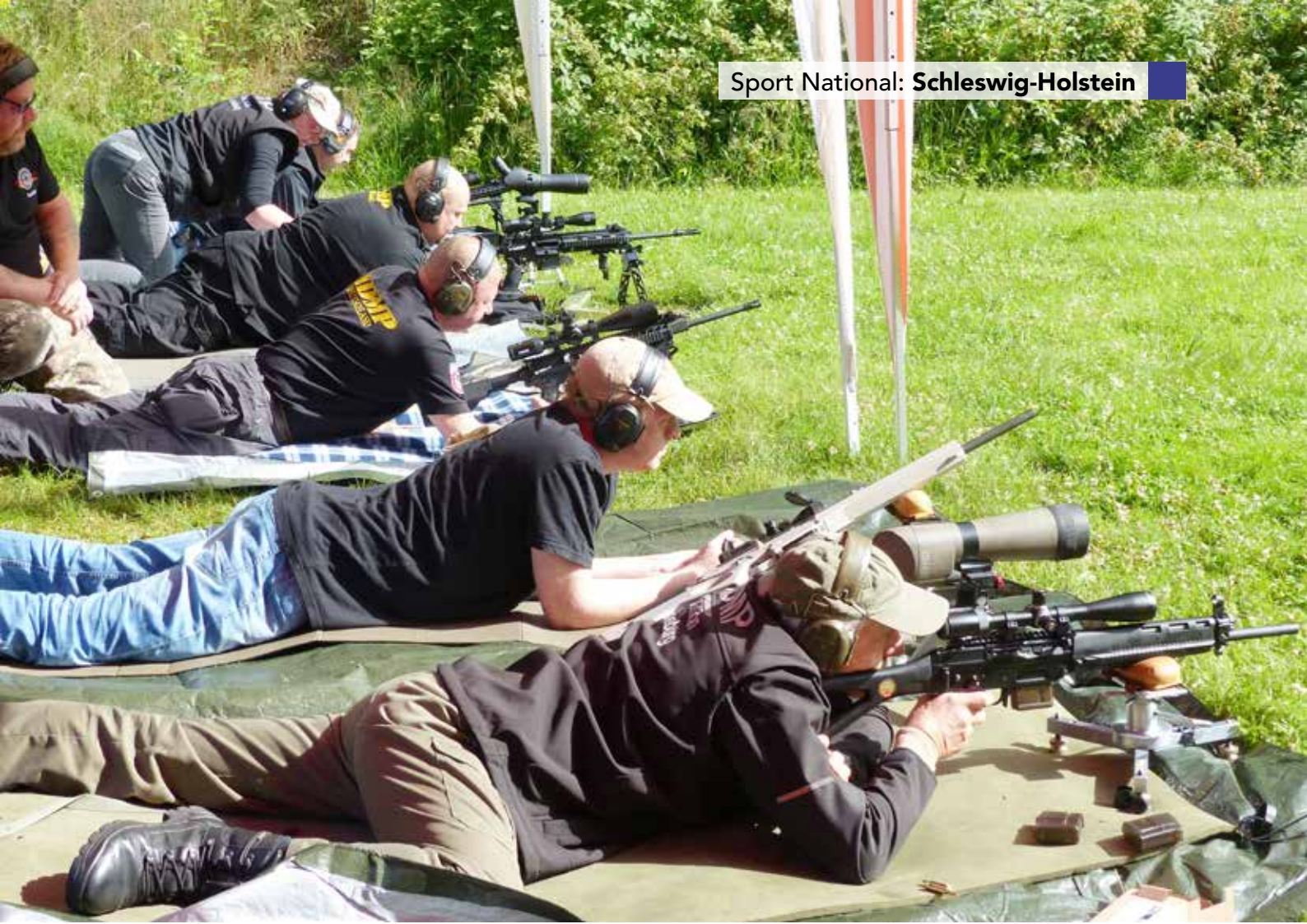
ZG1 modifiziert, nur Halbautomaten kamen zum Einsatz.