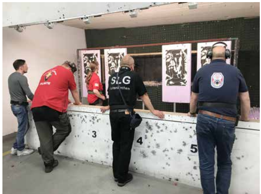
Begutachtung der Scheiben, die meisten waren zufrieden mit dem Ergebnis.

Schade das solche neuen Disziplinen so selten geschossen werden,