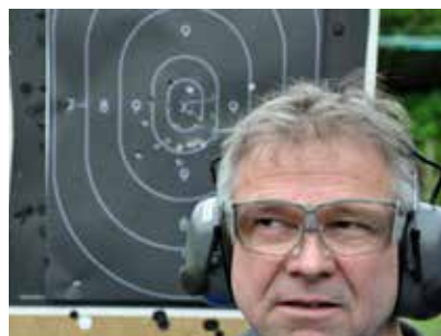
Wer hat mir die 9nen auf die Scheibe geschossen?