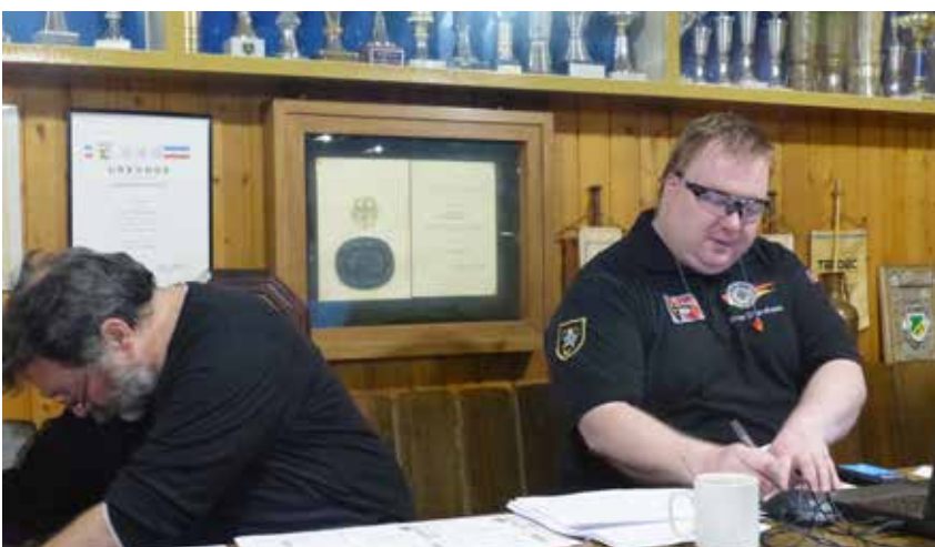
Die Organisatoren konnten sich über gelungene Landesmeisterschaften freuen.