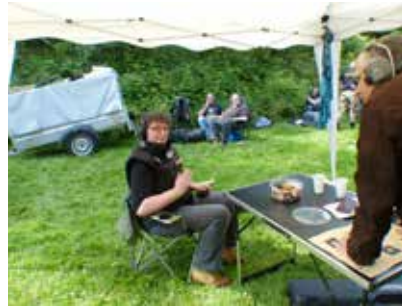
...und natürlich Gummibärchen.