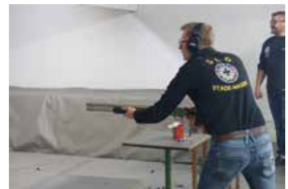
...warten auf das Startsignal.