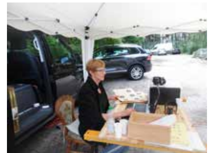
Anmeldung und Auswertung im Zelt.

Gesichter zu blicken und gemeinsam viel Spaß und Freude zu haben und die attraktiven Disziplinen unseres Verbandes im Original oder auch einmal abgewandelt zu schießen.