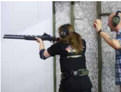
Die Zeit läuft!