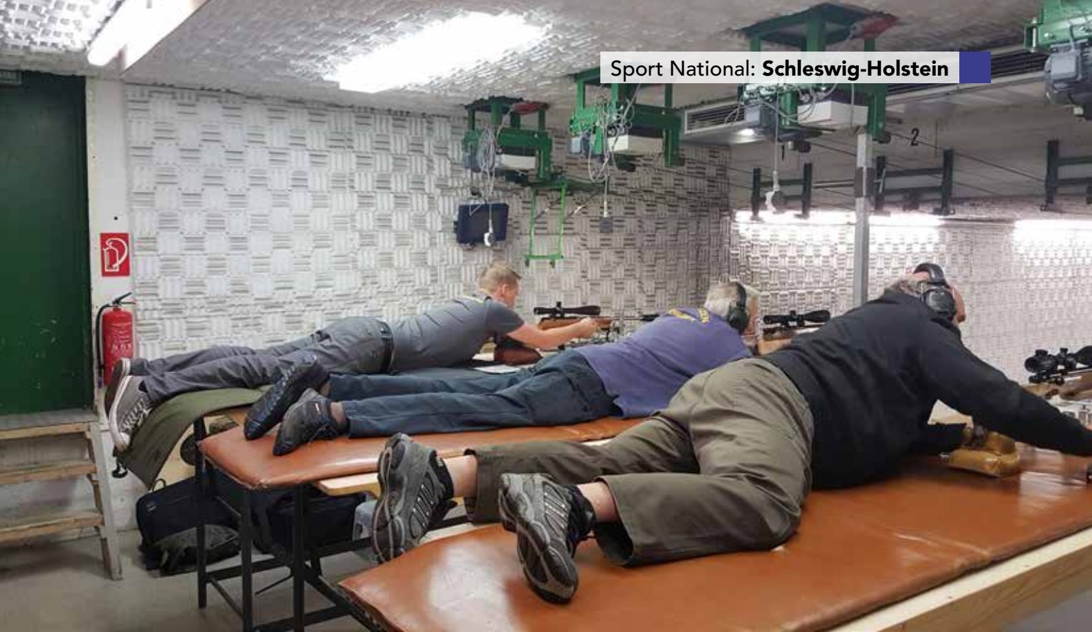
Volle Konzentration beim Wettkampf, die Voraussetzungen waren bestens.