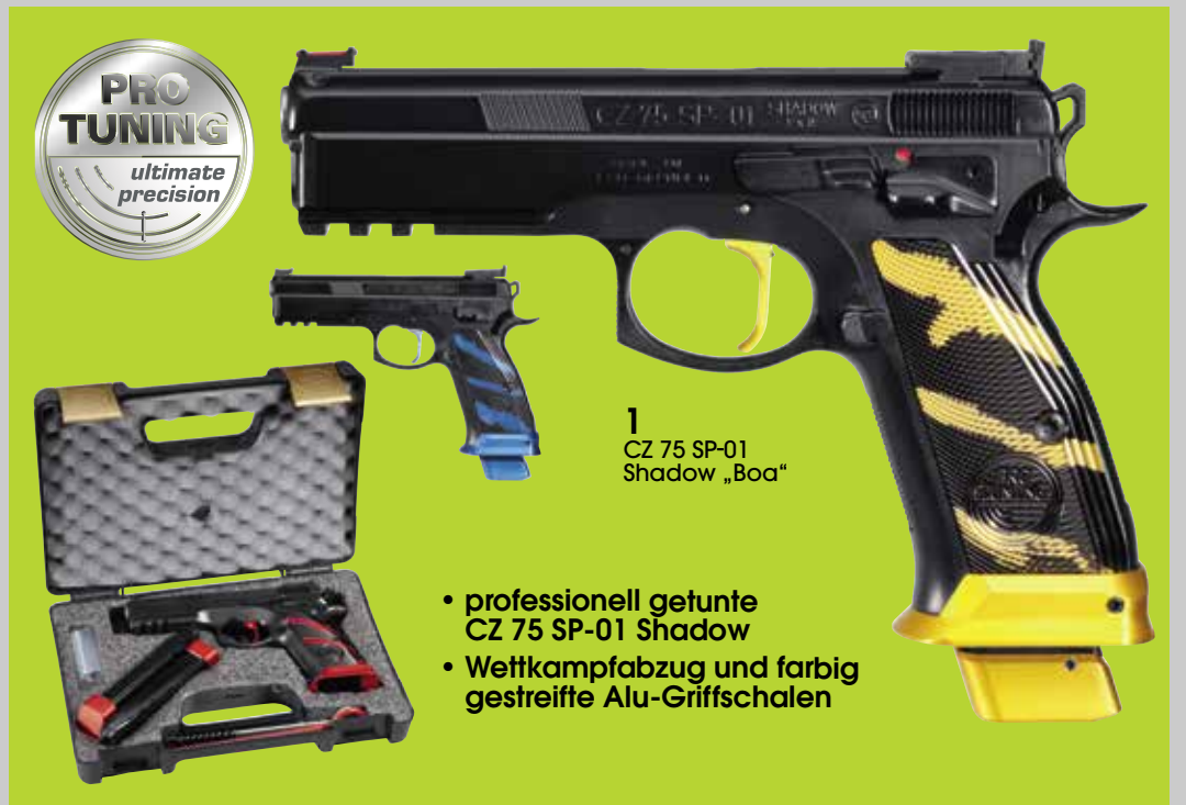
1 CZ 75 SP-01 Shadow „Boa“

Die gesamte Vielfalt von Pro Tuning und TopShot Competition unter frankonia.de