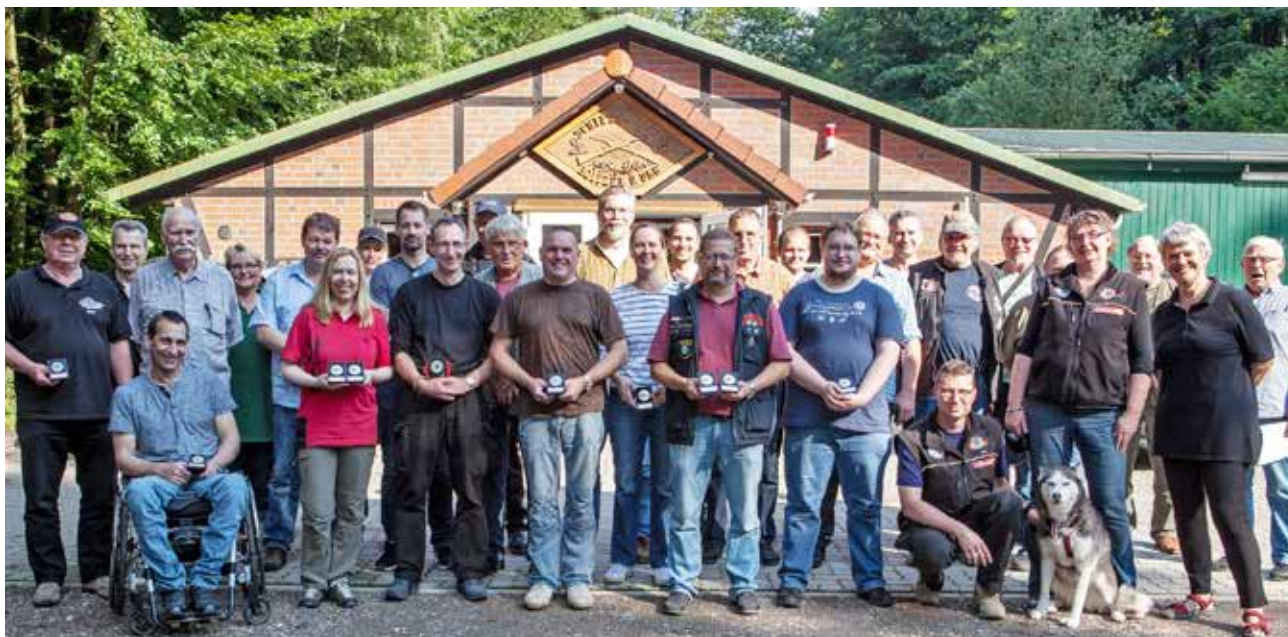
Die Teilnehmer der Landesmeisterschaften ZG1 und ZG4 in Boitzen.

Völlig unterschiedlich ist zum dritten aber vor allem die zur Verfügung stehende Zeit: Schier endlose dreißig Minuten für zwanzig Wertungsschüsse hat man bei ZG1, lediglich 32 Sekunden bei ZG4. Ein Wimpernschlag verglichen mit ZG1!