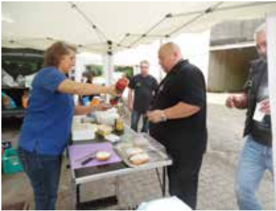
Brötchen, Frikadellen und Bratwurst.