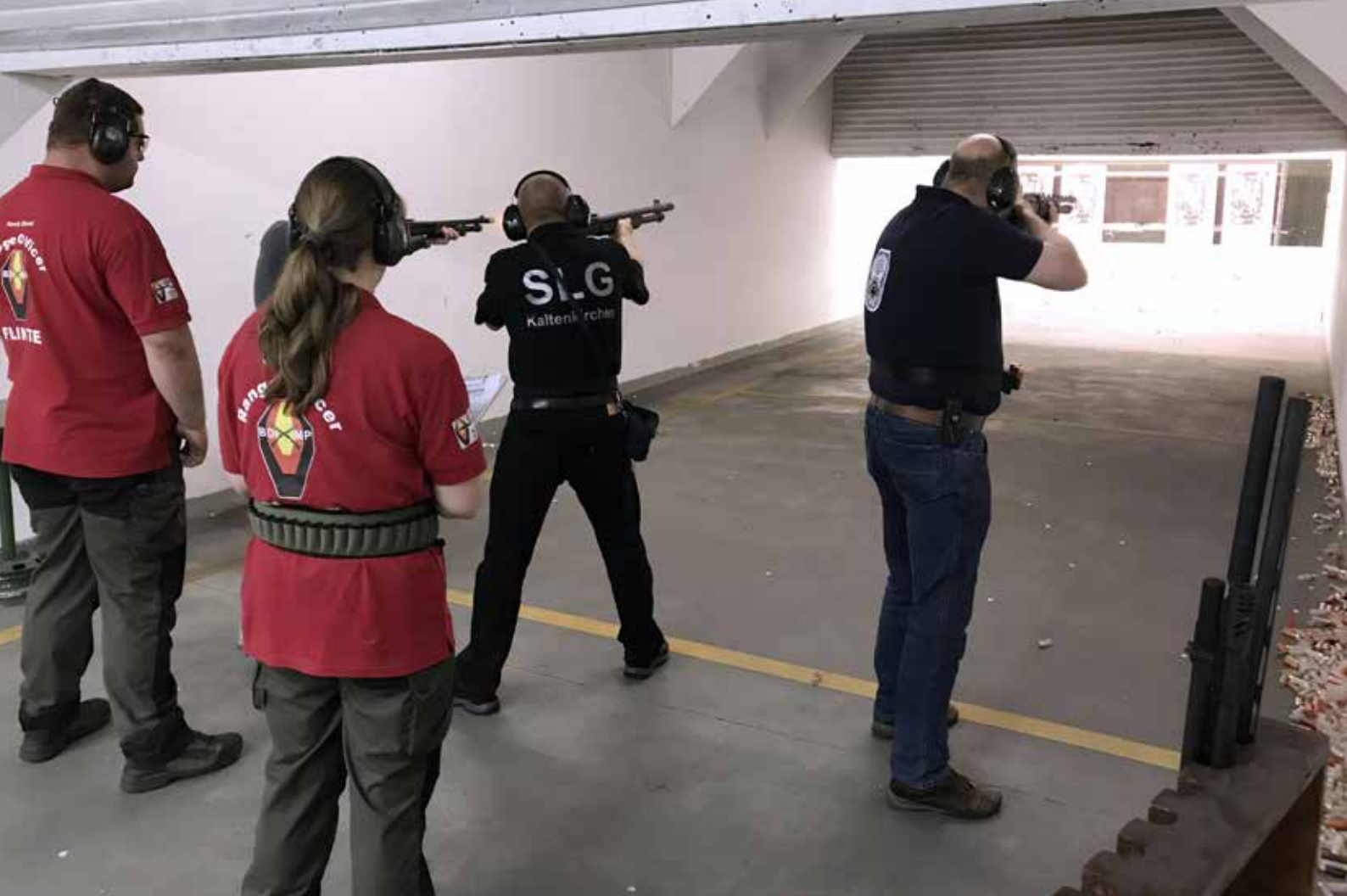
PP1 mit der Flinte.