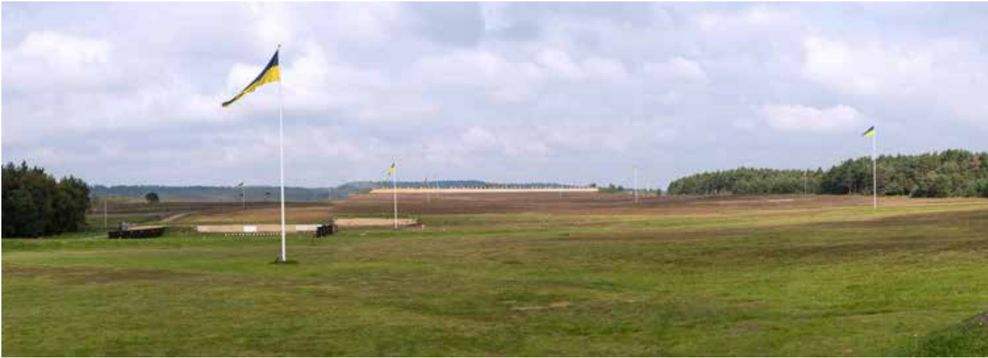
Stickledown mit dem angrenzenden Wald und Wind von rechts.

Marsh von der englischen Nationalmannschaft.