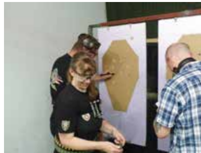
Marita ist anscheinend zufrieden.