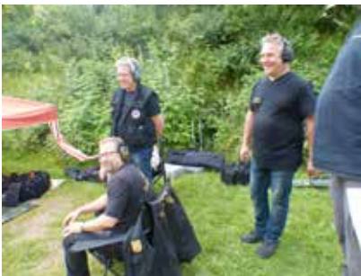
Stimmung? Wie immer klasse!