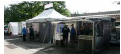
Die Zelte der Aussteller Nill Griffe und Jensen PSA.

von bspw. Ausgabe der Startunterlagen, Abrechnung, Auswertung, Überprüfung und Sicherstellung des Regelwerks auf den Anlagen und Auswertung, Waffenkontrolle etc. Unvorstellbares geleistet hat und vor allem, unsere Range Officer, deren sicherer und qualifizierter Einsatz dazu führten, dass es keine Vorfälle oder gar Unfälle gab. Wir danken Euch allen – toll das es Euch gibt!