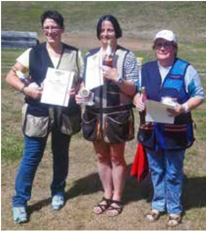
Die Skeet-Damen. Es hat ihnen offensichtlich sehr viel Spaß gemacht!

DM gelang das Dieter Neufing (SLG Saarpfalz e.V.).