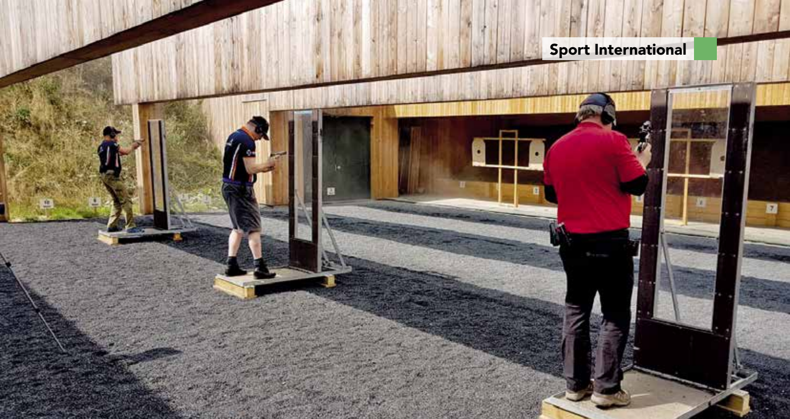
Barrikade Event bei den European Open, erste Position.