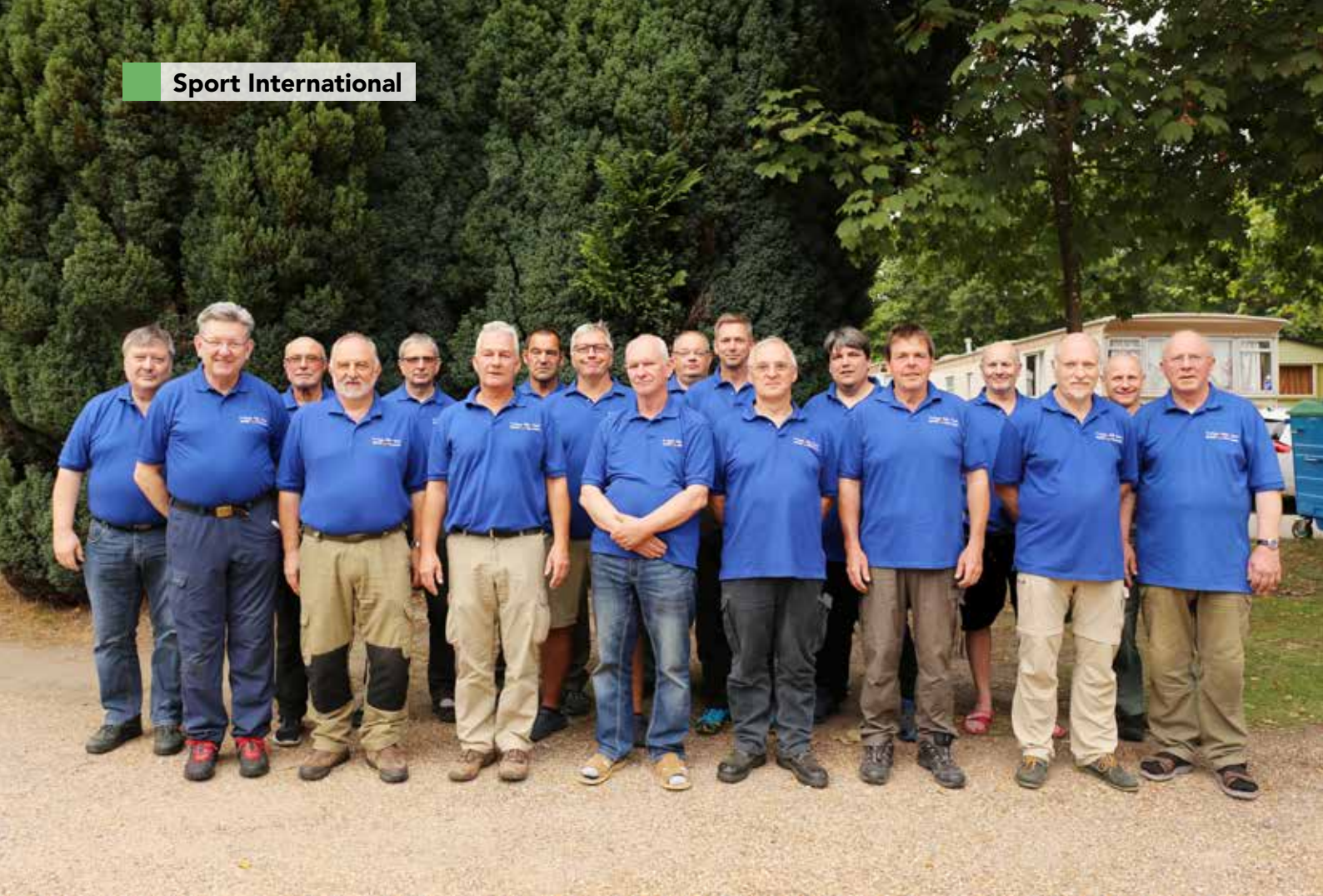
Die beiden BDMP-Mannschaften F-Class Open und F-Class TR.