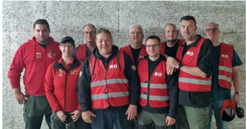
Die neuen und alten ROs.

rüber. Der Umgang mit den Waffen wurde in der Praxis auf dem Stand geübt.