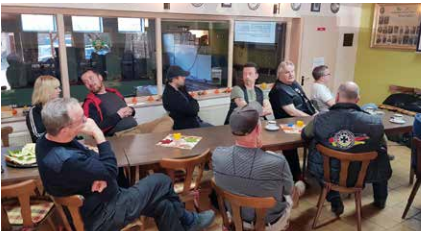
Die Teilnehmer des Einweisungslehrgangs.

Der Einweisungslehrgang in Theorie und Praxis lief perfekt ab. Marita kann nicht nur „betreutes Schießen“ anbieten, sie brachte auch die Theorie und praktische Tipps perfekt