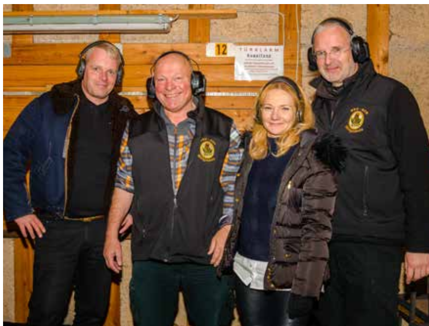
Das Wittgensteiner Sieger-Team.