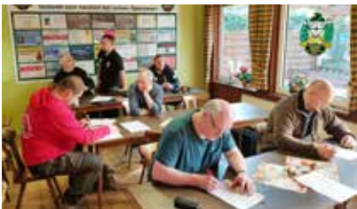
Das Fachwissen wird getestet...

Zusätzlich zu diesem Einführungslehrgang hatten sich sieben angehende ROs zur Prüfung angemeldet. Als erstes durften sie eine Prüfung über ihre Kenntnisse ablegen.