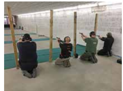
Zeitaufwendig ob im Stehen (Bild oben) oder im knien.

Die Organisation des Wettkampfes klappte wie am Schnürchen, schade dass durch den extremen Verkehr jede Menge Staus auf der Autobahn waren, dadurch konnten einige Starter leider nicht kommen, sie hatten die Anfahrt abgebrochen.