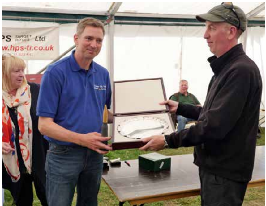
Sichtlich stolz: Europameister Alexander Kreutz.

Am Samstagmorgen wurde wieder auf 800 Yards der erste Wettkampf geschossen, die Wetterbedingungen waren teilweise wieder gut und so wurden wieder teilweise gute Ergebnisse geschossen. Anschließend wurde der 900 Yards Wettkampf aus-