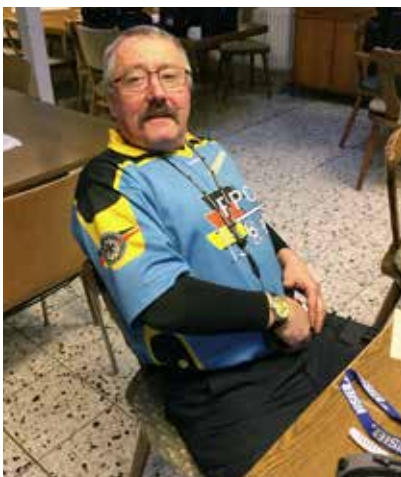
Auch ROs brauchen mal eine Pause.