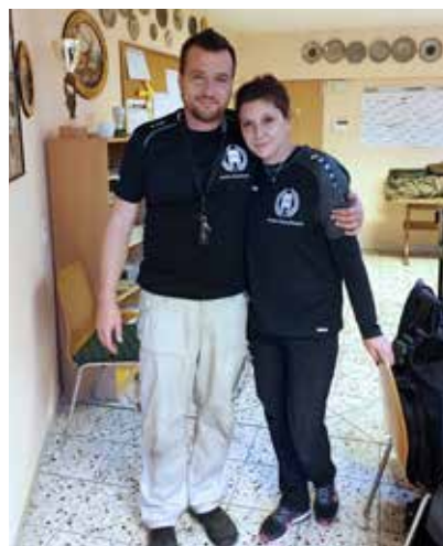
Geschafft, aber glücklich.

Die Wartezeiten zwischen den einzelnen Starts konnten auf vielfältige Weise überbrückt werden. Die „Kantine“ bot leckere Speisen, es wurde gegrillt und jede Menge geschmeckt wie man hier im Norden sagt.