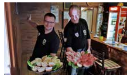
Nervennahrung... nett serviert.