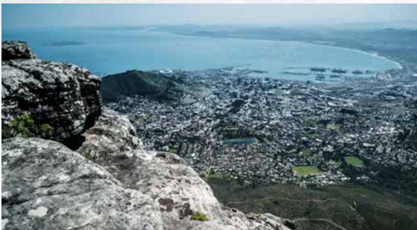
Blick vom Table Mountain auf Cape Town mit Signal Hill, WM-Stadion und Robben Island. Am Horizont, 40km entfernt, der helle Fleck: Die Atlantis Shooting Range, 1.000m...

Am nächsten Morgen fragen wir Roland nach den schießsportlichen Bedingungen in Südafrika. Und hören vieles, dass uns bekannt und nur zu vertraut vorkommt: Detaillierte Regelungen in Bezug auf den Legalwaffenbesitz und das Wiederladen, hoher bürokratischer Aufwand, lange Wartezeiten, Gebühren, Verzichtswang.