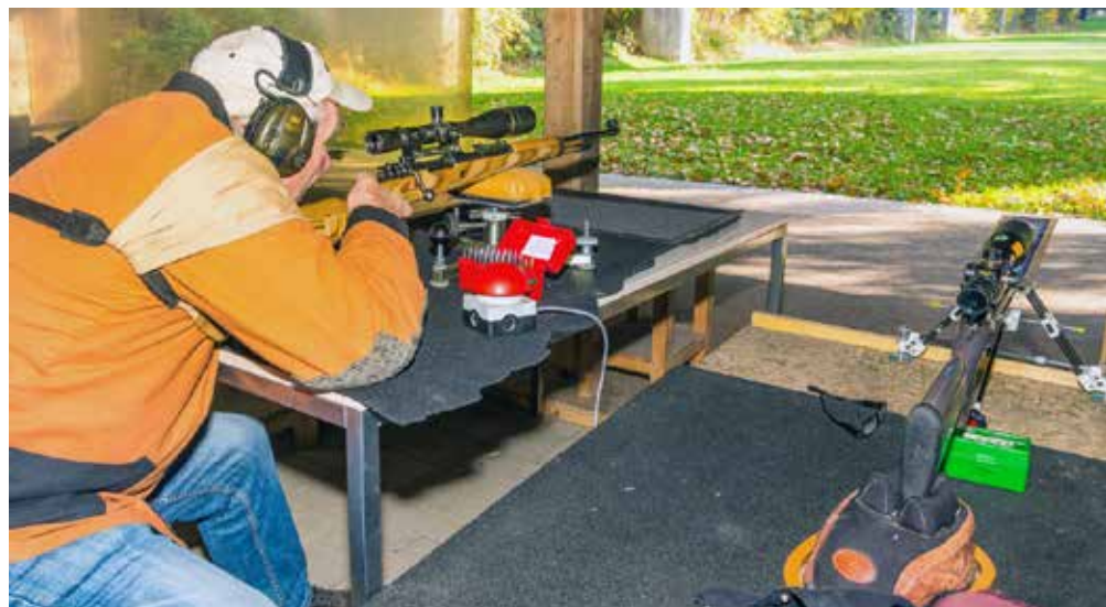
ZG1 mod 300m im Anschlag sitzend.

Fazit: Auch ohne unsere früheren Ergebnisse erreicht zu haben, war