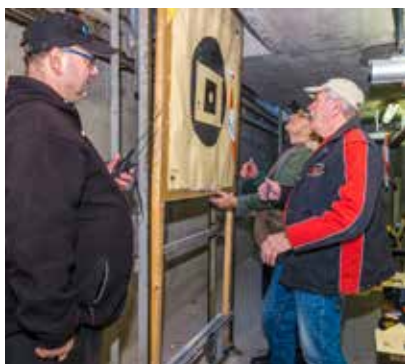
Arbeit in der Butt.

Der nächste Schritt ist organisatorisch schon vorbereitet: Im kommenden Jahr wird der Deutschland Pokal auf fünf Wettkämpfe, von denen zwei Streichergegebnisse sind, erweitert. Die angedachten Termine untenstehend.