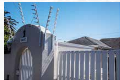
So sieht es aus, wenn der Staat das „Monopol der legitimen physischen Gewalt“ nicht mehr wahrnimmt – mene mene tekell...

Aber wir hören einiges, dass uns mehr als erstaunt: Die erste Waffe eines Schützen ist immer eine Waffe zur Selbstverteidigung. Sie darf auch außerhalb der Wohnung oder des Grundstücks verdeckt getragen werden. Selbstverteidigungstraining ist ausdrücklich erlaubt und wird praktiziert. Weitere geeignete Waffen darf man erwerben, wenn man als Dedicated Sport Shooter, als Sportschütze, registriert ist. Das Mindestalter