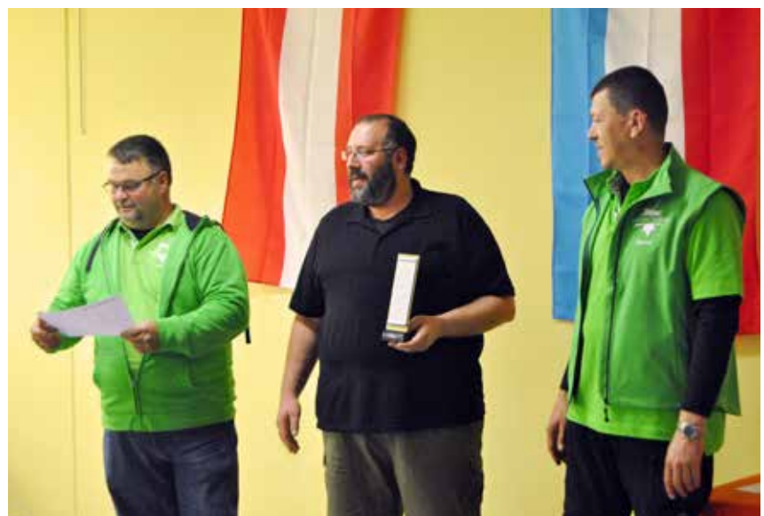
Gewinner der Autumn-Trophy Revolver.

Nach drei Wettkampftagen standen am Sonntagnachmittag die Sieger und Platzierten fest.