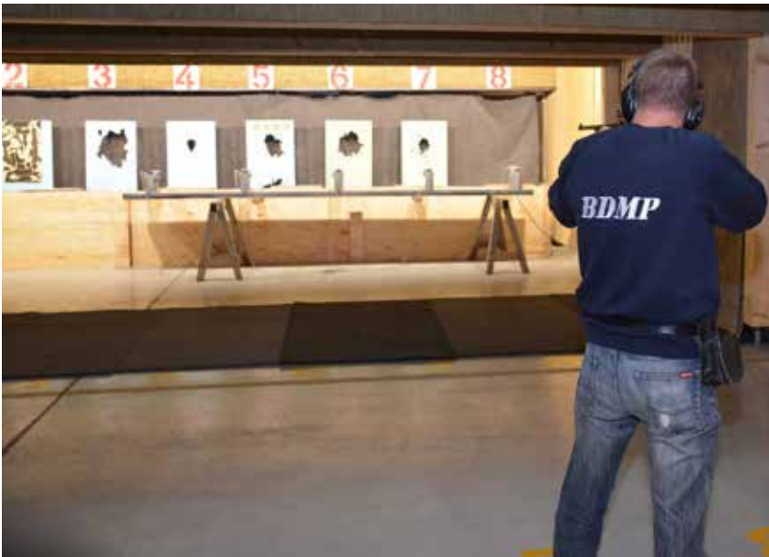
An der 10m-Linie.