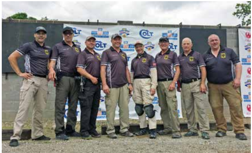
Mannschaftsfoto US Bianchi Cup.