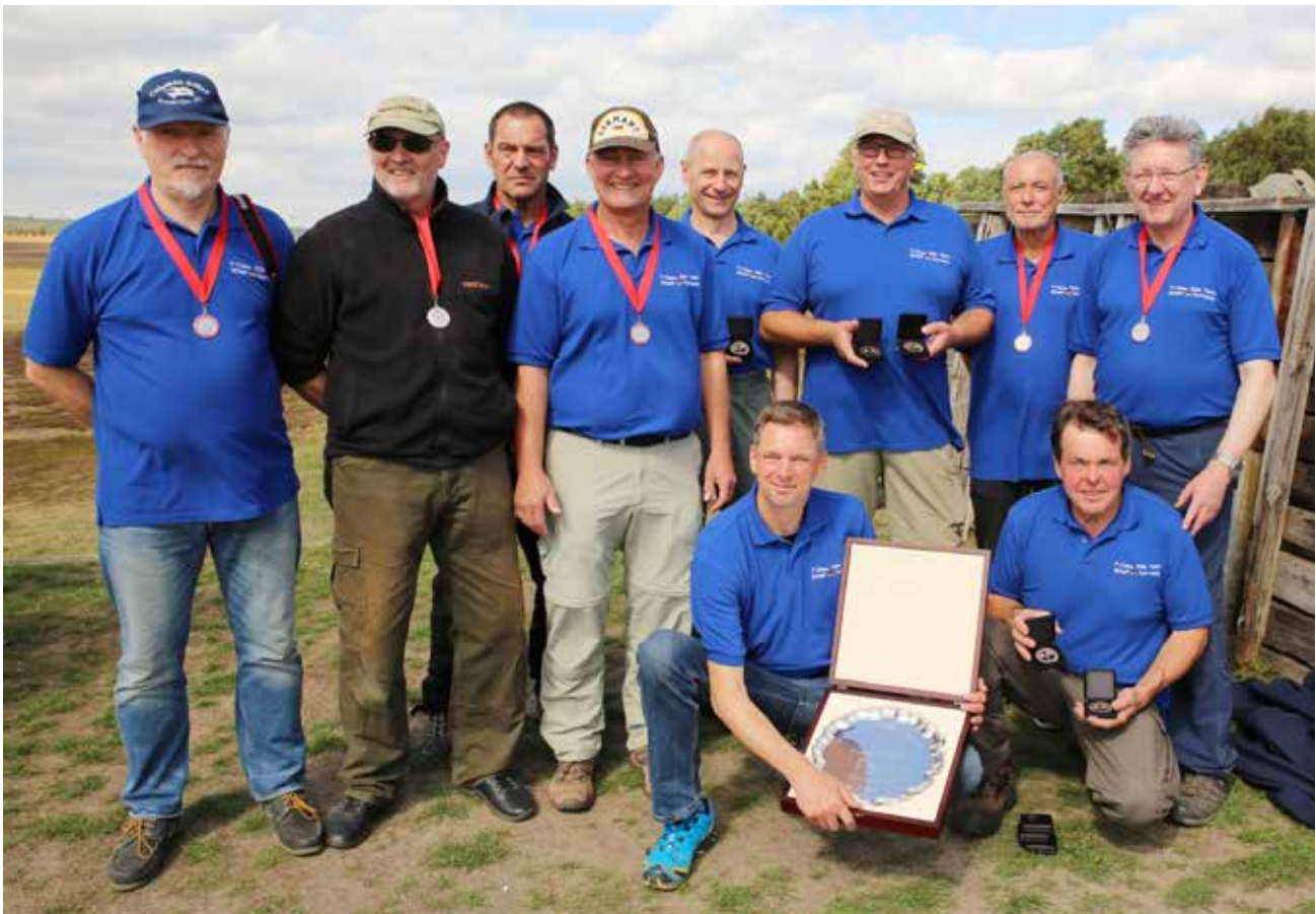
Gruppenbild mit allen siegreichen Schützen.

■ Text: Volker Zeitz