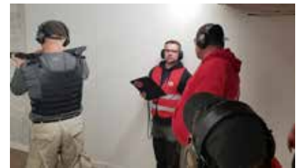
Sicherer Umgang mit der Flinte ist unumgänglich.