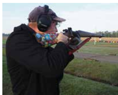
Stehend auf der Century Range.

Neben den vielen Liegend-Disziplinen kann auch im Stehen geschossen werden, sei es wie hier zu sehen auf der Century Range mit dem Dienstgewehr auf 200 yds, oder aber auf der Melville Range mit dem Unterhebler auf kurze Distanzen.